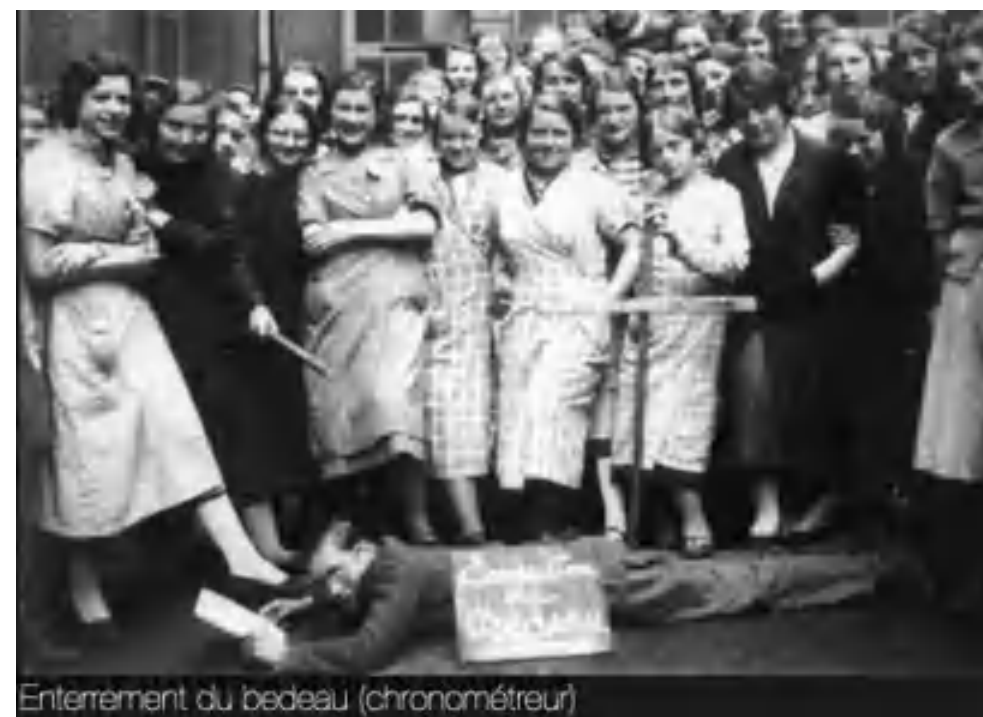
Enterrement du bedeau (chronométrateur)