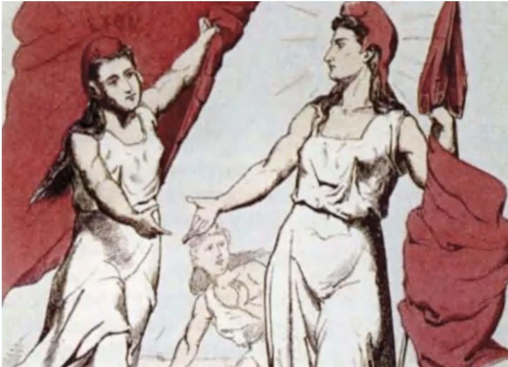
Dessin de Moloch, 1871