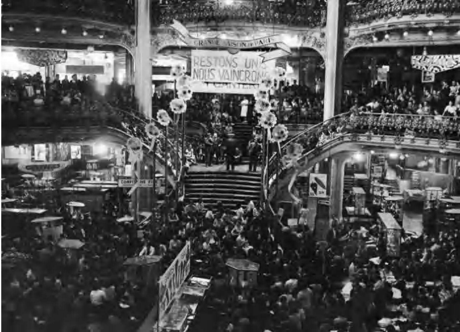
Léon Jouhaux devant les grévistes des Galeries Lafayette, mai 1936